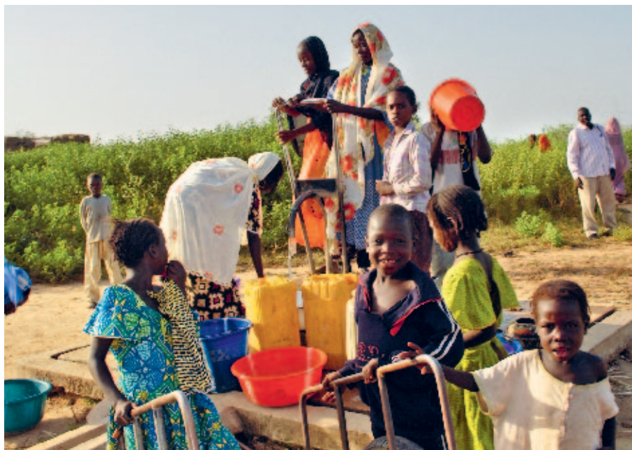
Sauberes Trinkwasser ist grundlegend für die Gesundheit der Kinder. Ein neuer Pump-Wasserbrunnen bei der Schule wird dafür Sorge tragen.

Gute hygienische Bedingungen beim Schulbesuch und die Sensibilisierung der Familien für Hygiene im Alltag sind zentral, um den Gesundheitszustand der Kinder zu verbessern. Ein neuer Brunnen – ausgestattet mit Wasserreservoir und Wasserhähnen – wird den Zugang zu sauberem Wasser sicherstellen. Eine Toilettenanlage ermöglicht zudem die Einhaltung wichtiger Hygienestandards. Die Lehrer werden entsprechend geschult, um die Kinder und deren Eltern in Hygienemassnahmen einzuführen und für deren Umsetzung zu sorgen.