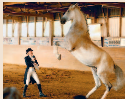
In eigener Sache: Zu Gast bei Christine Stückelberger