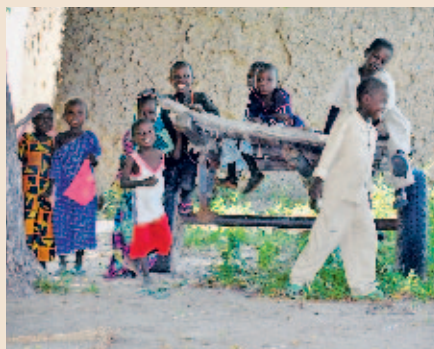
Bericht aus dem Tschad: Reiche Böden, armes Volk