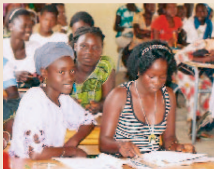
Projektbericht: Über unsere Schulen in Afrika und Haiti

Im Tschad sollen die Kinder zur Schule gehen dürfen