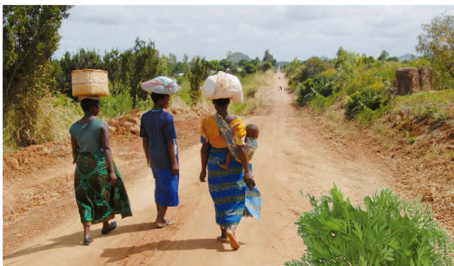
Oft eine Herausforderung: Transport der Produkte vom Feld auf den Markt.

Unser Projekt setzt auf drei Ebenen an: Ein erstes Ziel ist es, die Bäuerinnen und Bauern in verbesserten Anbautechniken zu schulen, sodass sie selbst Qualität und Quantität der Gemüsesorten langfristig steigern können. Dafür werden Schulungsfelder eingerichtet, wo auch verbessertes Saatgut produziert