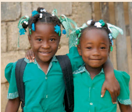
Projektbericht aus Haiti: Wiederaufbau von Schulen

Bessere Methoden sollen Senegals Mütter aus der Armut helfen