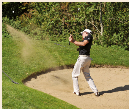
In eigener Sache: 50 engagierte Golfer spielten für guten Zweck